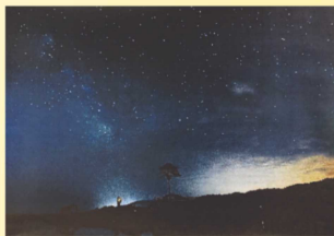
街は明かりを失い そこには輝く星たちが...