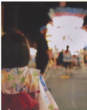
沿道の人々 賑わい 毎年あたり前にやってきた日常がそこにありました。

七夕まつりは、江戸時代より受け継がれてきた伝統の祭りです。その意味は、その年に新盆を迎える方々の霊を弔うためだと言われています。だからこそ、2011年震災の年も、のこった山車で祭りを続け、がれきの街を練り歩きました。町内が会が解散し、住む場所が変わっても続けていく人々の想いがつまった祭りです。