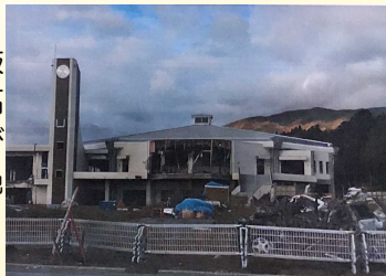
あの日を物語る姿

七夕まつり当日には、山車の上で太鼓を叩き、笛を鳴らし大勢の人で引き、高田町内を練り歩きます。夜には、きらびやかな電飾を仕込んだ山車の装飾にお色直しをし再び高田の町を練り歩きます。